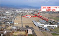
（仮称）屋代スマートインターチェンジ整備事業

（仮称）屋代スマートインターチェンジの開設を含めた交通インフラを活用した物流関連産業・成長ものづくり産業分野の促進