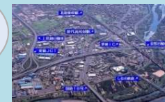
高速交通網のクロスポイント