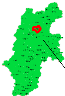
左：促進区域の長野県内での位置 下：促進区域全体の地図

なお、自然公園法に規定する国立公園及び国定公園、自然環境保全法に規定する原生自然環境保全地域、自然環境保全地域及び県自然環境保全地域、絶滅のおそれのある野生動植物の種の保存に関する法律に規定する生息地等保護区、環境省が自然環境保全基礎調査で選定した特定植物群落、生物多様性の観点から重要度の高い湿地、自然再生推進法に基づく自然再生事業の実施地域並びにシギ・チドリ類渡来湿地は、本区域には存在しない。